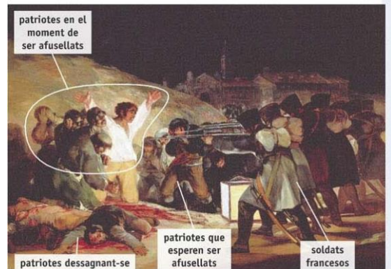
El 3 de maig a Madrid o Els afusellaments de la Moncloa, 1814.