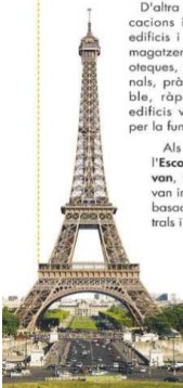
La torre que l'enginyer Gustave Eiffel va construir per a l'Exposició Universal de París del 1889 es va convertir en l'edifici més alt del

Als Estats Units, els arquitectes de l'Escola de Chicago, com Louis Sullivan, van alçar els primers gratacels i van inaugurar una manera de construir basada en espais amplis, grans finestres i una gran quantitat de pisos.