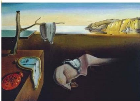
Salvador DALÍ: La persistència de la memòria , 1931.