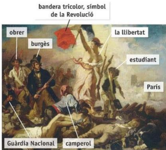
Eugène DELACROIX: La llibertat guiant el poble , 1830. El quadre enalteix les jornades de juliol del 1830 i mostra la unió de diferents sectors socials en la seva lluita per la llibertat.

Identifica cada obra tot escrivint l'autor, el títol, i l'estil artístic