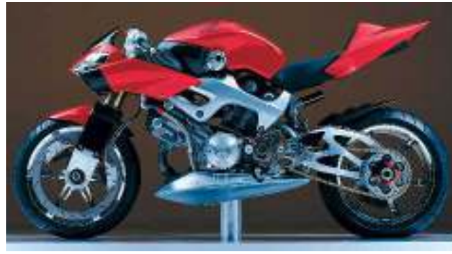
HONDA NAS U_2